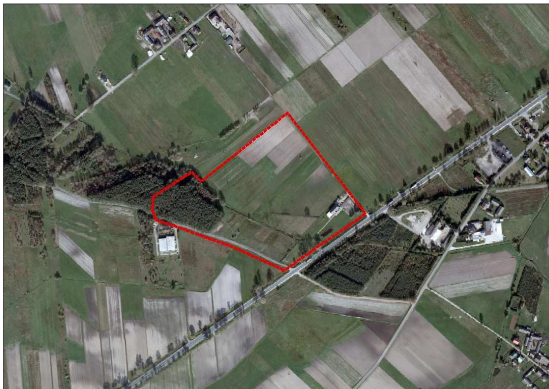
Rysunek 1. Istniejące zagospodarowanie obszaru objętego sporządzeniem planu

Teren objęty opracowaniem położony jest w pobliżu kompleksu leśnego, położonego w Mazowieckim Parku Krajobrazowym i pozostaje w granicy jego otuliny. Na omawianym obszarze przeważają niezabudowane tereny rolnicze, a część terenu pokrywają zadrzewienia sosnowe. W granicach opracowania, bezpośrednio przy drodze krajowej nr 50, znajduje się Karczma Człkówka będąca obiektem usługowym.